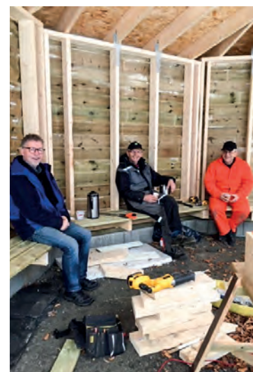
3 gode dugnadsfolk på Stemnestaden.

Det utføres en stor dugnadsinnsats på alle leirstedene i løpet av året. Takk for all frivillighet både i bønn og arbeid. Sammen bygger vi kraftsenter for framtida.