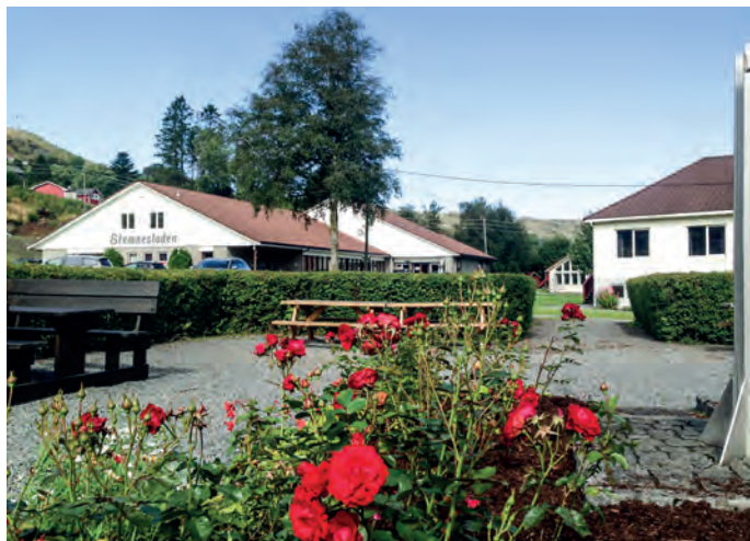
Vi sees på Stemnestaden 6. april.