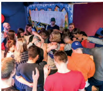
Verdifulle unge står sammen om å nå nye.

Ungdommene tok det seriøst og jobbet godt med problemstillingene om disippelskap og hvordan de kan bety noe for andre ungdommer. De ble også utfordret på hvordan