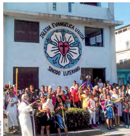
Glade kirkemedlemmer på Cuba!

– For IEU betyr dette en trygghet for at vi er del av det internasjonale lutherske fellesskapet. Vi er ikke alene lenger, vi er i følge med andre, sier biskop Ismael Laborde Figueras.