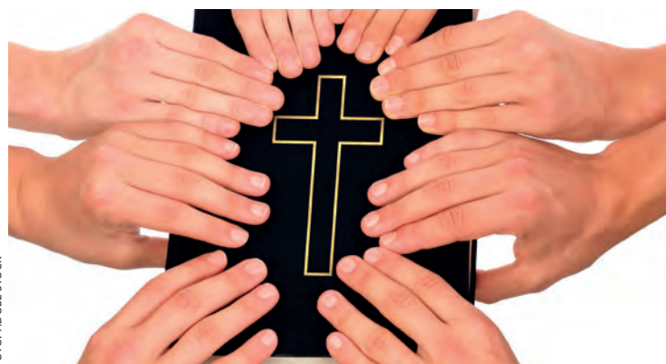
Flere foreninger har benyttet seg av tilbudet om bibelundervisning gjennom regionens disippelskole.

fremskritt, Når Herren kommer og Livet i menigheten. Disippelskolen har vi hatt i Kristiansand, Bykle, Byremo, Bjelland, Lillesand, Vegårshei, Åmli, Bøylestad og Eydehavn. Høsten 19 er det igjen tid for ledermøter. Høsten 18 hadde vi ledermøtene på den måten at representanter fra Regionen kom på besøk til den enkelte foreningens styre. Dette var meget lærerikt for alle parter. Det vil bli gjentatt i en eller annen fasong høsten 19.