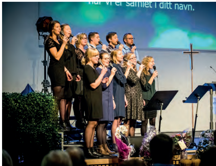
Det er mye allsidig sang og musikk i Norkirken Grimstad. Her representert ved Høysangerne