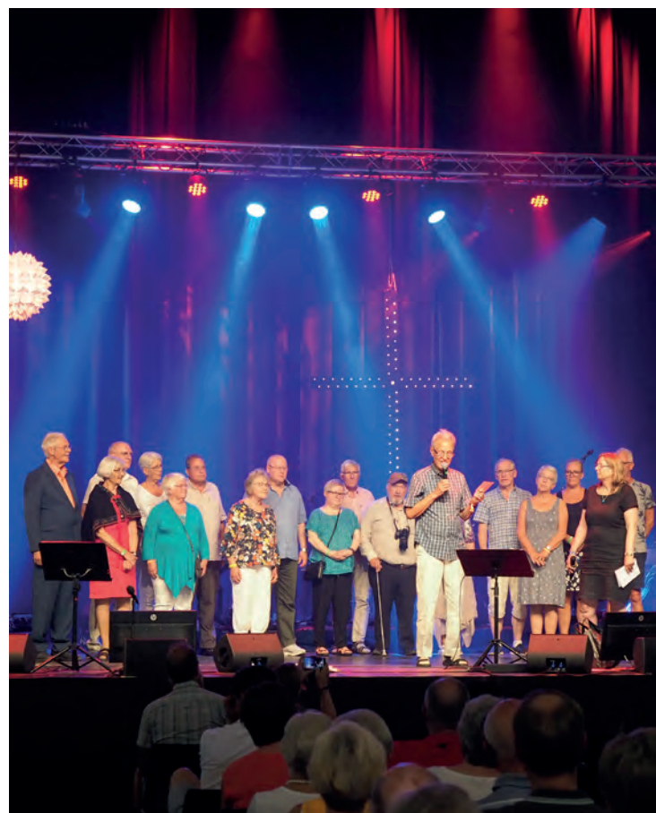
Mange tidligere misjonærer til Ecuador var samlet for å markere jubileet på Normisjons generalforsamling i sommer.