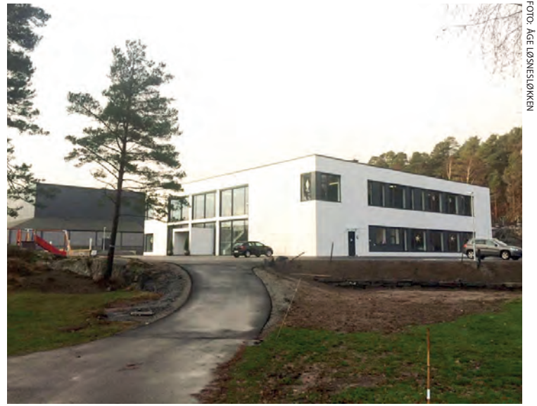
Regionens årsmøte avholdes 6.april i Norkirken Grimstad.

På formiddagen er det menighetene som har ansvar for programmet. De vil lede lovsang og fortelle fra arbeidet de står i. Spennende og utfordrende tema som vil bli belyst: Hva er en Norkirke, og hvorfor opprette menighet? Hva er forskjellen på