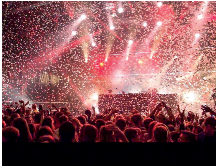
Fest, fyr og flamme: Åpningskonsert med Jesus loves electro.

Vi vil være en kirke med et klart Jesus-fokus og en tydelig bibelbruk; det skal skinne gjennom i alt vi gjør.