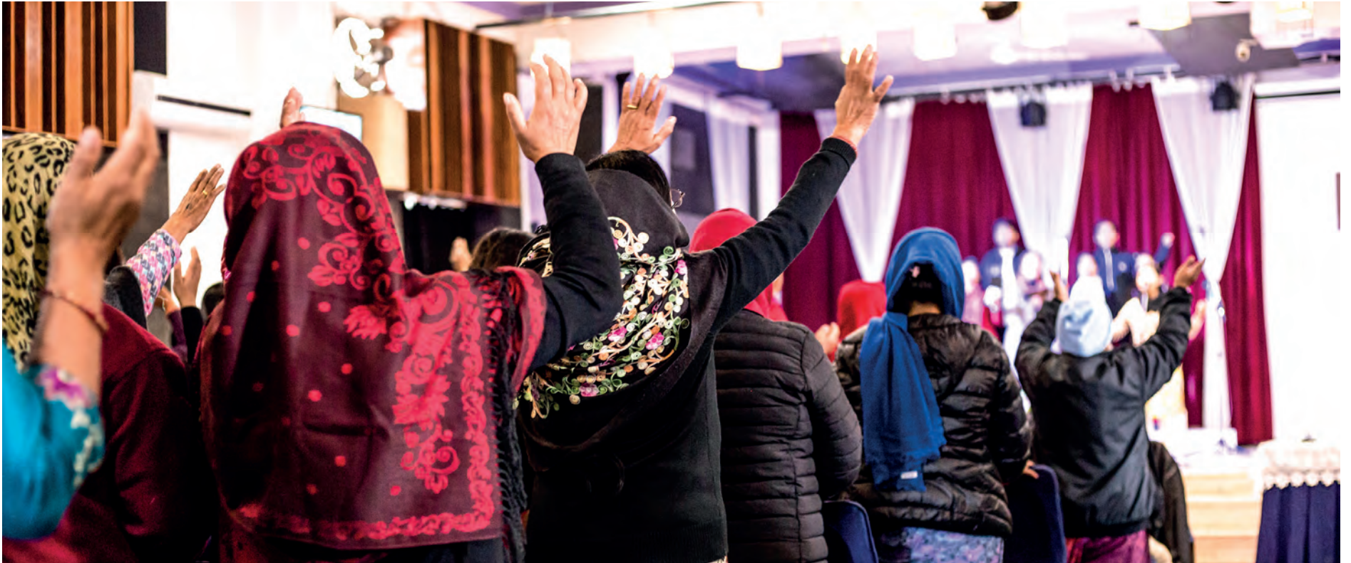
Lovsangen runger i hele bygningen når det er gudstjeneste i kirken i Patan