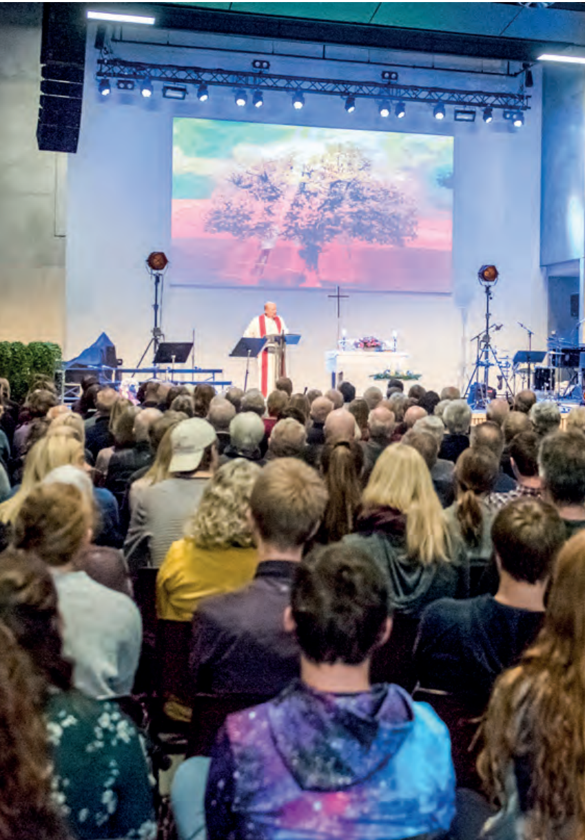
Fullt hus under åpningshelgen, og siden har oppslutningen på gudstjenestene vært stor.

beid. Både det som skjer under gudstjenestene og det som skjer ellers gjennom uka.