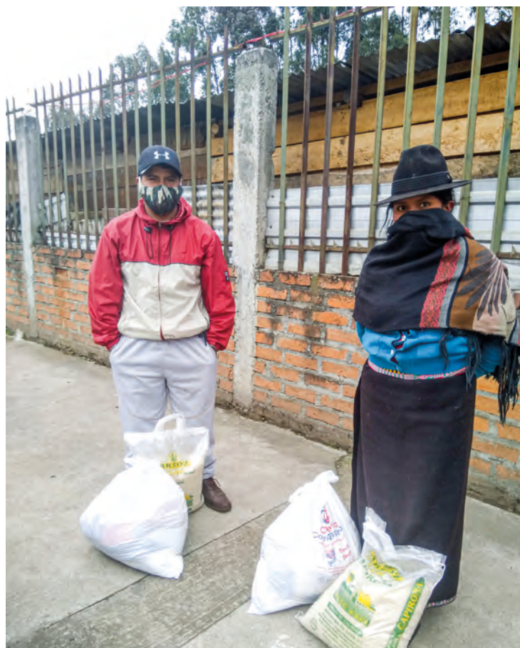
Fra utdeling av mat til korona-rammede i Ecuador.

Be for ungdommer og ledere som må tenke nytt for fellesskap.