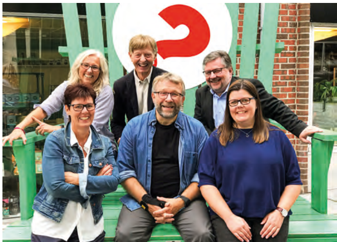
Styret i jubileumsåret inviterer med glede til ledersamlinger flere steder i landet denne høsten.