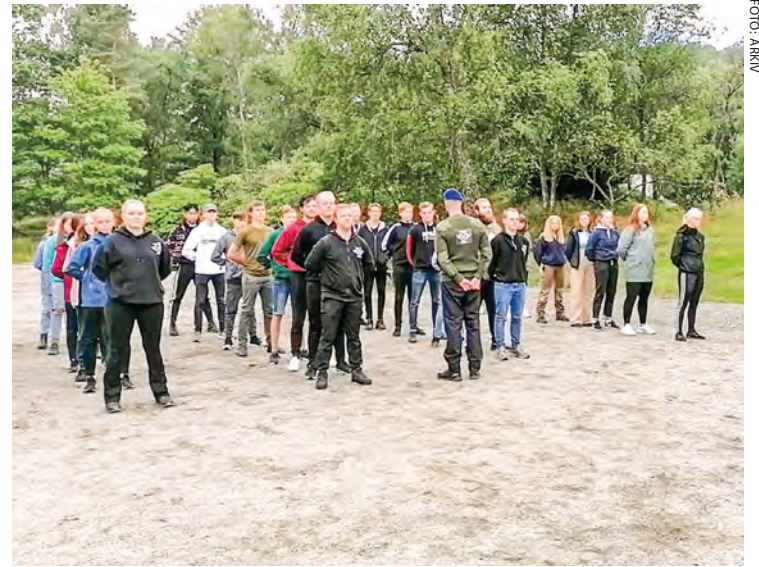
Kompani Thesen stiller opp.

Opplegget endte på Horve 2 der vi lagte tomatsuppe fra bunnen av på stormkjøkken. Det var mange deltakere som aldri hadde brukt stormkjøkken før, og samarbeidet ble satt på prøve når man var sulten og sliten. Men dette var dagens lunsj, så