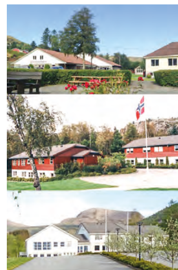
Leirstedene våre er trygge og klare til å ta imot gjester.

Vi gleder oss til å fylle husene igjen. Og inntil videre skal vi vaske hender, holde avstand og sørge for at vi har nok håndsprit tilgjengelig. Velkommen til et trygt opphold!