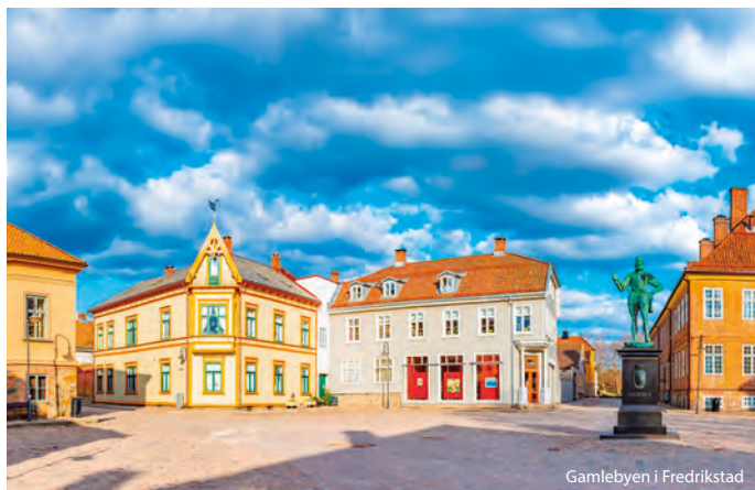
Gamlebyen i Fredrikstad

Bli med på årsmøtet for å høre om det som skjer!