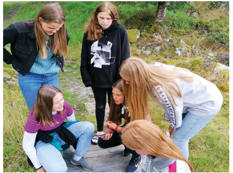
Verdifulle unge får hjelp til å bli disipler og ledere.

Sammen istandsetter vi unge, bevisste ledere som er trygge i troen, og som ønsker å prege samfunnet positivt. Ledere som kjennetegnes av troverdig, tydelig og tjenende livsstil og lederskap. Vi setter den enkelte lederen i fokus, stiller spørsmål, gir støtte og veiledning når det trengs. Derfor kaller vi det LEDERFOKUS . I smågrupper og samtaler med mentor bygges relasjoner, og vi får se gavene