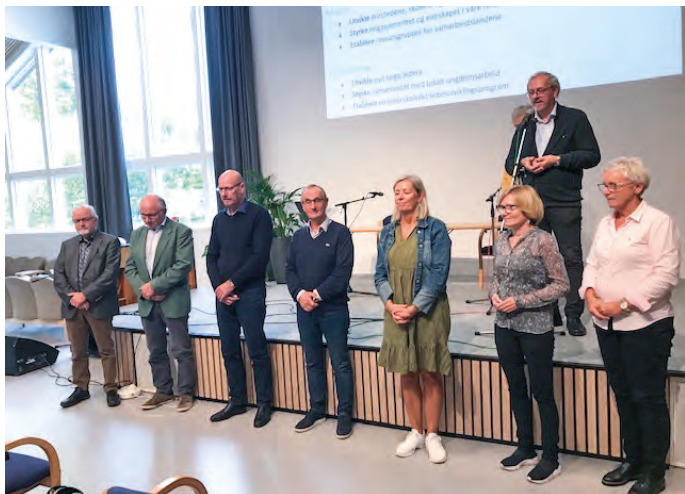
Bønn for nytt regionstyre under regionårsmøtet 2020.