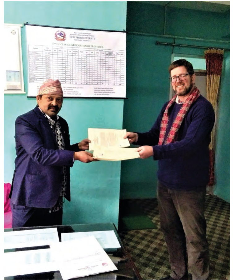
Helsedirektør i Provins 1 i Nepal og generalsekretær i UMN med den signerte samarbeidsavtalen.

Be for alle de barna og ungdommene som ikke får være med på leir og på lokale aktiviteter. Be om at de har det bra og kjenner at de er nær til Jesus.