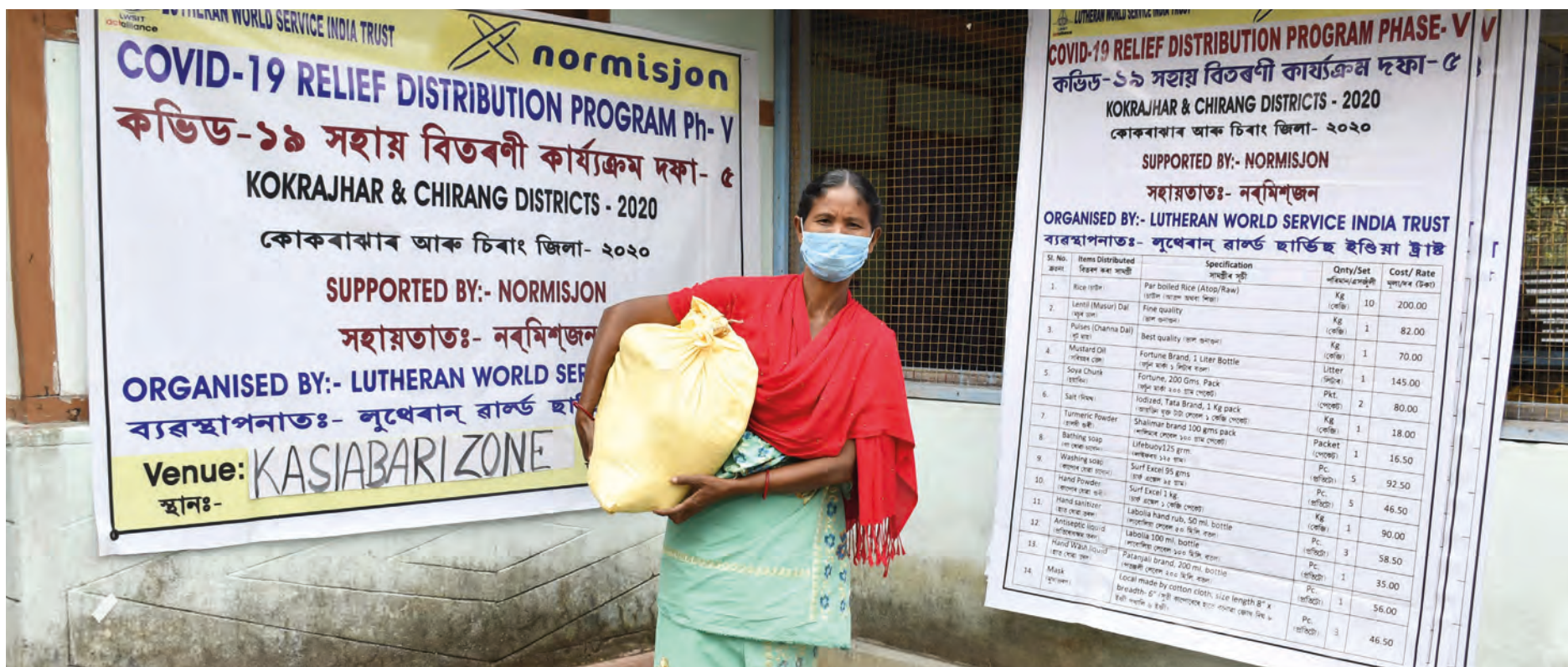
Koronahjelp: Denne kvinnen er hovedforsørger for familien sin i India. Her har hun fått utdelt hygieneartikler, ris, linser og mer gjennom LWSIT og Normisjon.