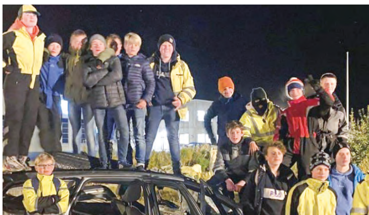
Momentum knuser bil.

Samlivskurset «7 kvelder om å være 2» startet opp for 13. gang, til stor velsignelse for parene som deltar. Fokus på å bygge sterke og gode samliv har gode ringvirkninger i familiene, i bygda og samfunnet rundt oss.