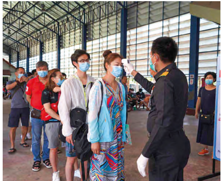
Også i Kambodsja rammer korona først og fremst indirekte.