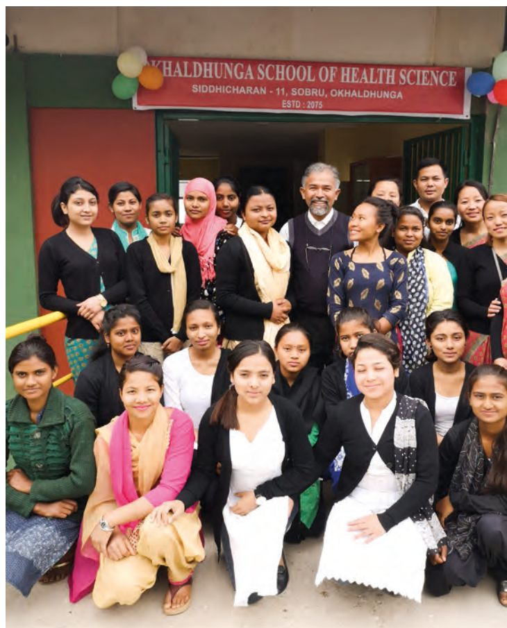
Elever og lærere ved den nye skolen på åpningsdagen.