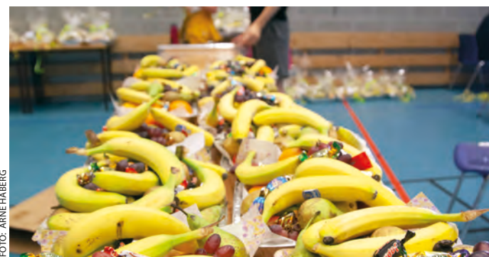
Mykje arbeid lagt ned for å gjere ein skilnad på Sri Lanka.

Elevane brukte ein dag på å gå ut og ta opp bestillingar, og det gjekk ein dag til pakking og levering av korgene. Aksjonen selde om lag 140 korger, og vi håpar at ryktet om fruktkorgene spreier seg slik at vi kan selje endå fleire neste påske!