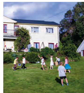
Barn kan kome på leir og klubb, vaksne på arbeidsferie.

Frivillig på Teigen i sommar? Teigen er avhengige av dugnadsheltane våre, og de som ber, for både arrangementa og plassen vår. Tusen takk! I sommar har vi nokre veker vi ønskjer å tilby arbeidsferie. Det vil seie at du har tilbodet om å komme på Teigen ei veke utan kostnad, for å enten vere vertskap eller delta på ulikt arbeid. Send oss nokre ord på teigen@normisjon.no om du har lyst, eller ring 412 83 744.