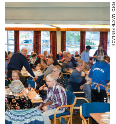
Nokre av dei som hygga seg på Fjordlybasar.