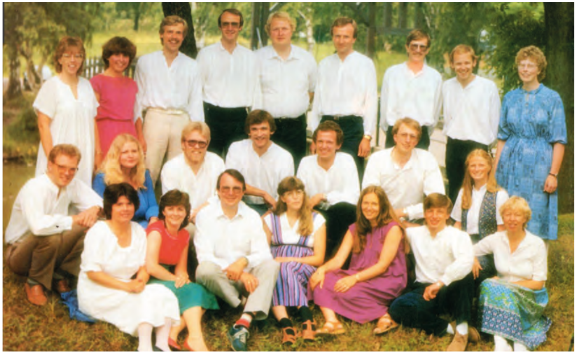
Slik husker nok mange Minikoret. 28. september er det flere grå hår og færre fargede brilleglass når koret feirer sine femti år.