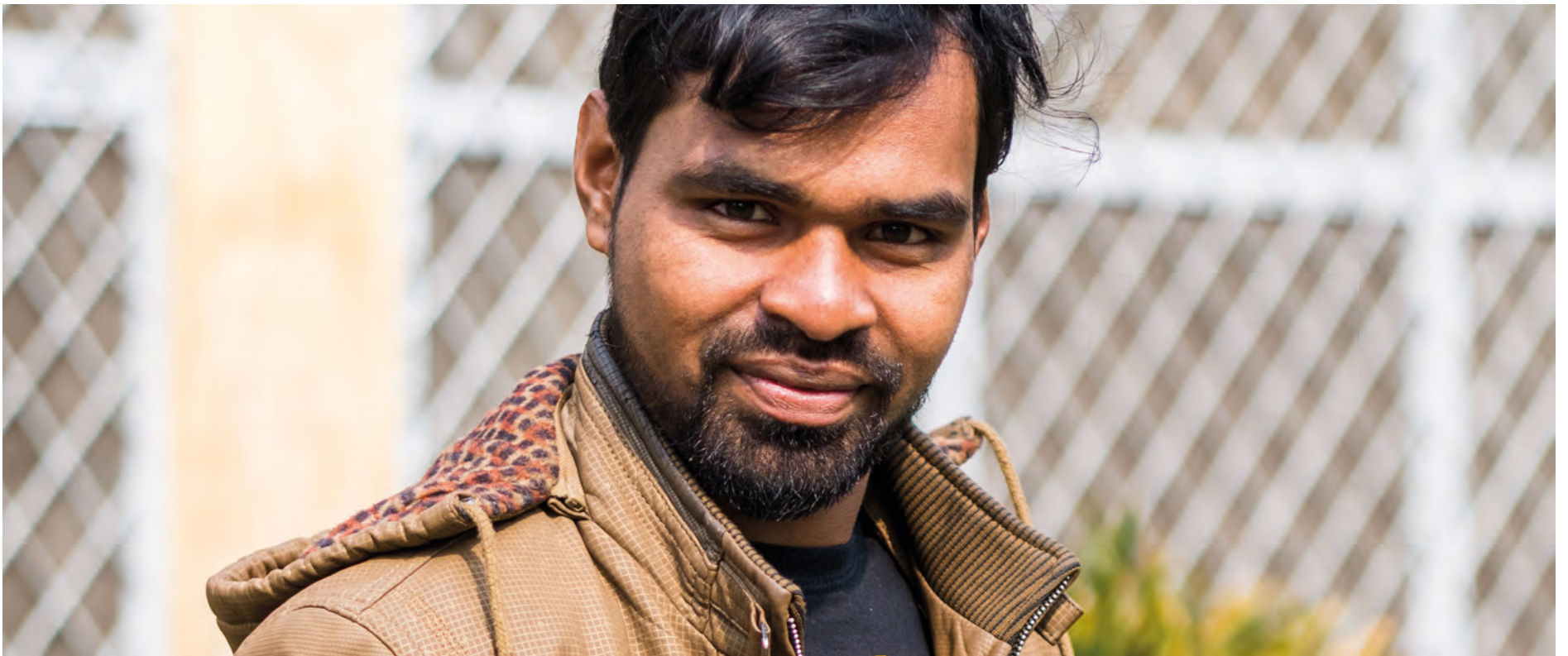
Bijoj er i ferd med å avslutte studiene sine. Han er takknemlig for mulighetene han har fått.