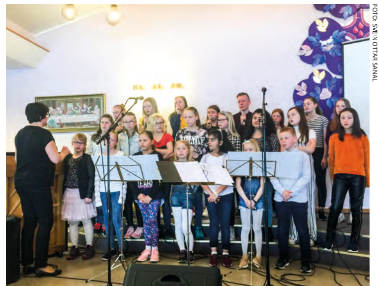
Olden Soul Children song under Soulchurch på årsmøtet i Innvik.