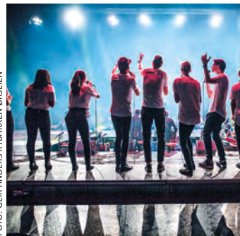
Oslo Soul Teens under Soul Children-festival i 2018.

Meir informasjon kjem på nettsidene våre.