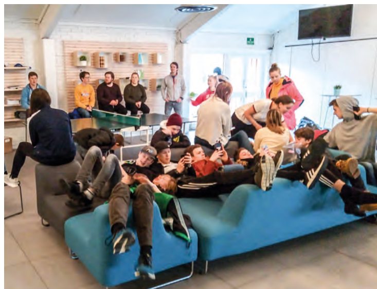
Litt avslapping mellom slagene.

svært mange gode argumenter for at Jesus har levd, lever og er sannheten.