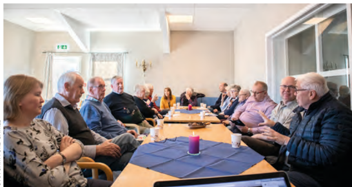
På siste møte med Skiensforeningene var alle voksenforeninger representert

Resultatet av møtene er at det skal være to fellessamlinger for foreningene i Skien i løpet av høsten, 15. september og 24. november. Det er regionen som skal stå for samlingene, med inviterte talere utenfra.