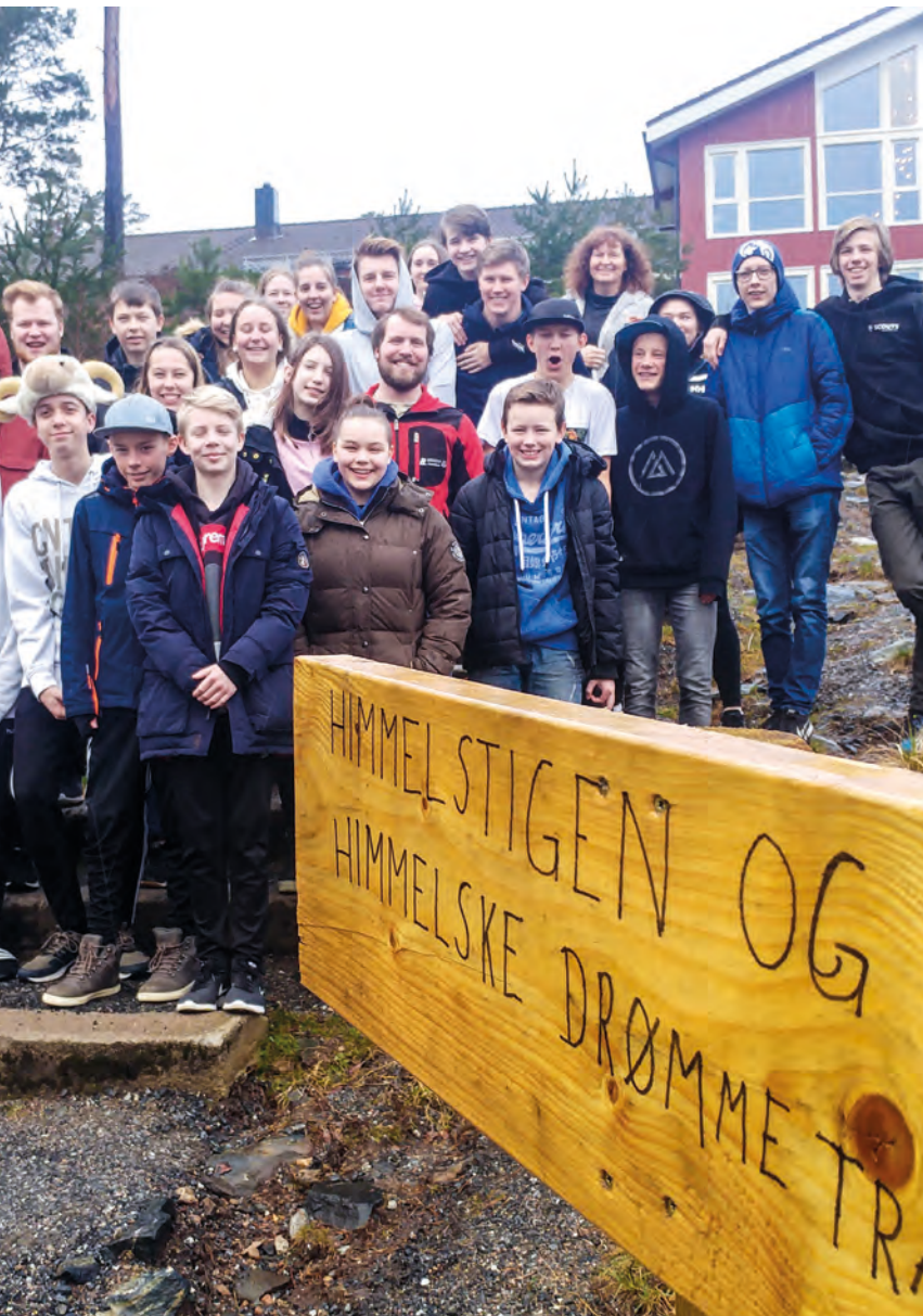
Se denne flotte gjengen, som alle er ledere i Acta Telemark! Vi takker dem og BiG for en super lederhelg!

mange gode svar. Lederne ble også utfordret til å søke sannheten selv, og ikke uten videre tro på alt det de hørte fra panelet. En påstand som ble litt ransakende var denne: «Du vil tro på sannheten, ikke på kristendommen».