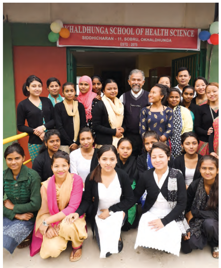
Elever og lærere ved den nye skolen på åpningsdagen.