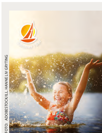
Sommer i Sør i Grimstad 9.-14. juli.

Du kan lese mer og melde deg på på www.sommerisor.no .