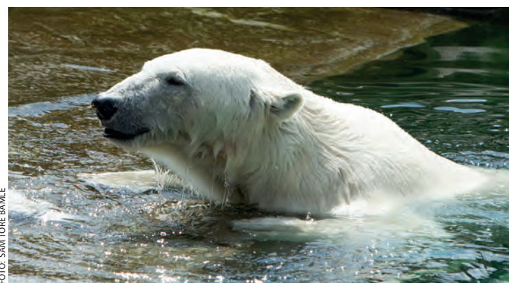
Noen melder seg på 24h bare fordi det er mulig å bade i løpet av festivalen.

Vi takker for engasjementet for leirstedet og for den store gaven!