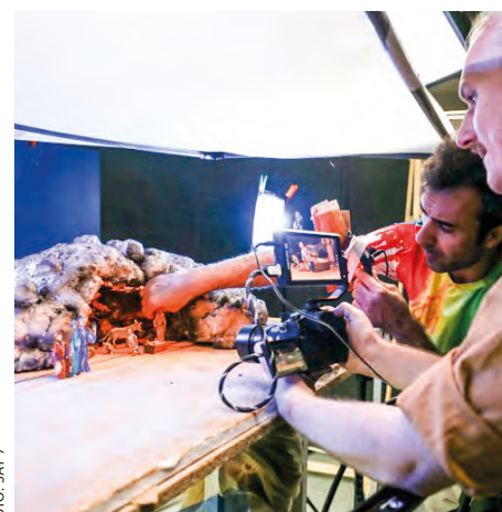
En egen verden med animerte figurer skal levendegjøre Bibelen for barn.

For å engasjere persisktalende barn med historier om Jesus, jobber et kreativt team i SAT-7 PARS med å produsere en ny, animert bibelserie. Disse unike animasjonene viser Jesu liv, og er så fengslende at både barn og voksne vil ha glede av dem. I studioet til SAT-7 PARS i Limassol, Kypros, har frivillige og ansatte laget figurer og andre effekter for hånd. Etter måneder med hardt arbeid, kommer nå endelig dette lille universet til sin rett.