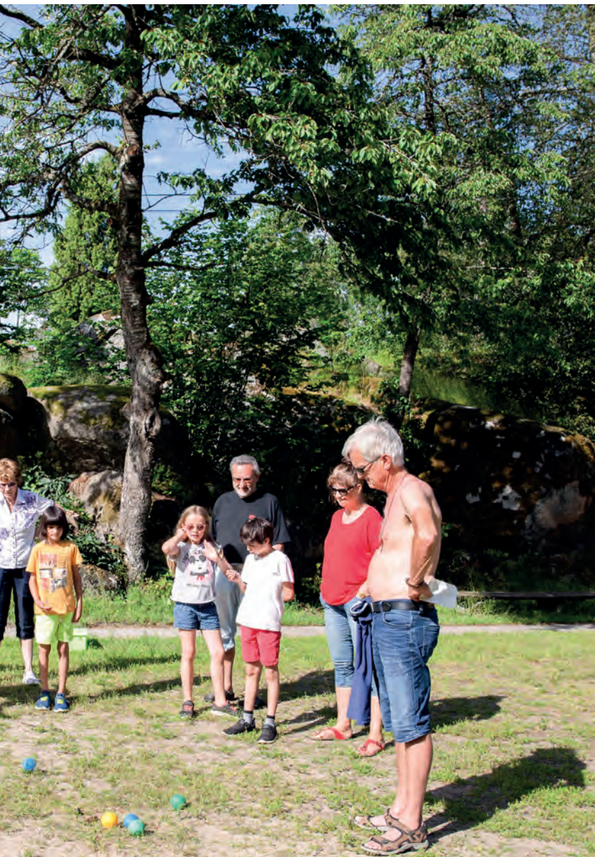
Boccia-turneringen på besteforeldre-barnebarneleiren engasjerte små og store.