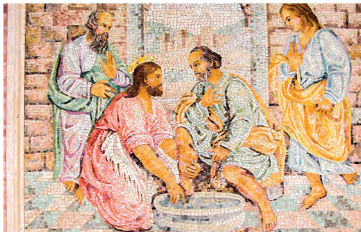
«Herre, vasker du meg?» Mosaikk fra Roma.

som oppstod i Stavanger, så vidt jeg vet. Forsamlingen i IMI kirka skulle gjøre folk i sine nabolag tjenester de trang hjelp til, uten å forlange penger for dette. Nå har dette spredd seg til vår region, og i Kviteseid har de god erfaring med denne formen for diakonalt arbeid. Bedehusfolket er kjent for en stor dugnadsinnsats. Kanskje har vi drevet dugnad i feil hus, eller med feil fokus?