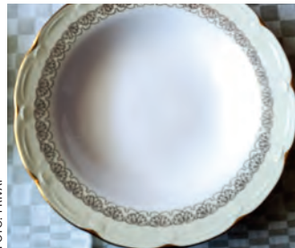
Mønsteret på serviset.

En misjonsvenn vil selge et Marie middagsservise fra Figgjo Flint til inntekt for misjonsprosjekt i Mali og Bangladesh. Serviset er lite brukt og består av 44 deler.