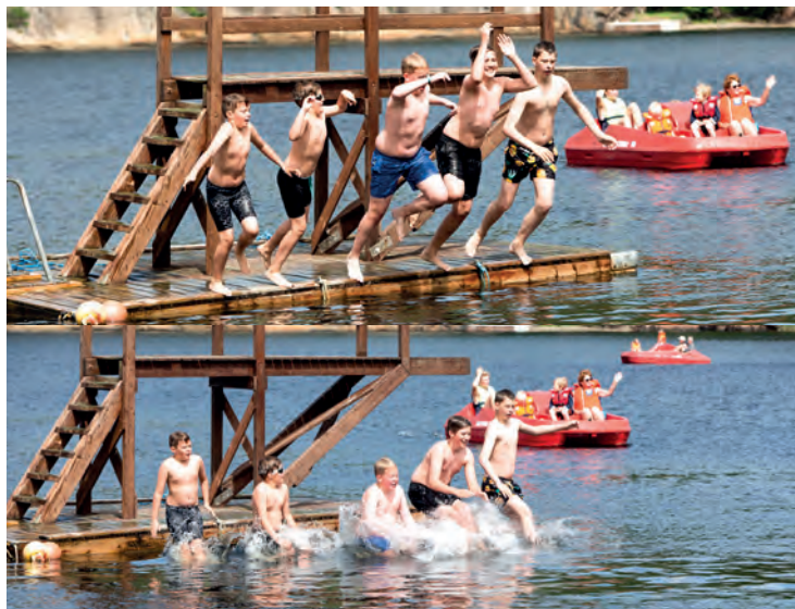
Bading er en viktig ingrediens på sommerleir.