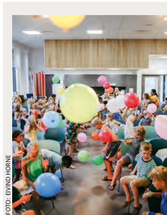
Lek og moro, undervisning og fellesskap for de miste.

” Det ble en super sommerfestival i Grimstad.