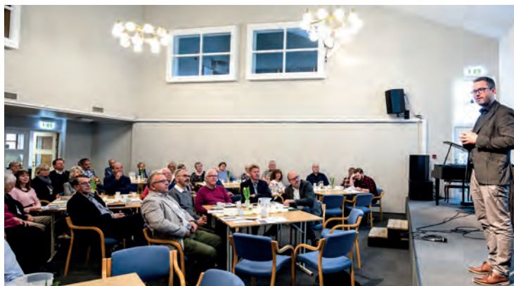
Fra regionårsmøtet 2019.

Det blir sendt ut innkalling til alle foreninger før møtet.