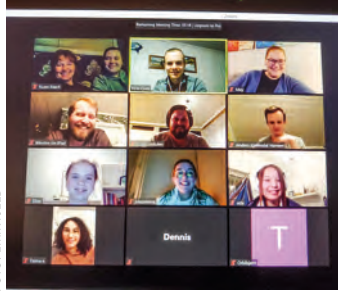
Nye muligheter med Zoom.

Norge. Og jeg kan være enig i mye av det. Når vi ikke lenger kunne samles fysisk, så måtte digitale læringsplattformer og andre plattformer tas i bruk over natta. Det har Acta og regionen også gjort. Utallige møter på Zoom, Whereby, Skype og Teams har blitt holdt. Noen regioner har til og med hatt årsmøter digitalt og et par regioner har hatt digitale leirer i påska. Det er kun kreativiteten som stopper en!