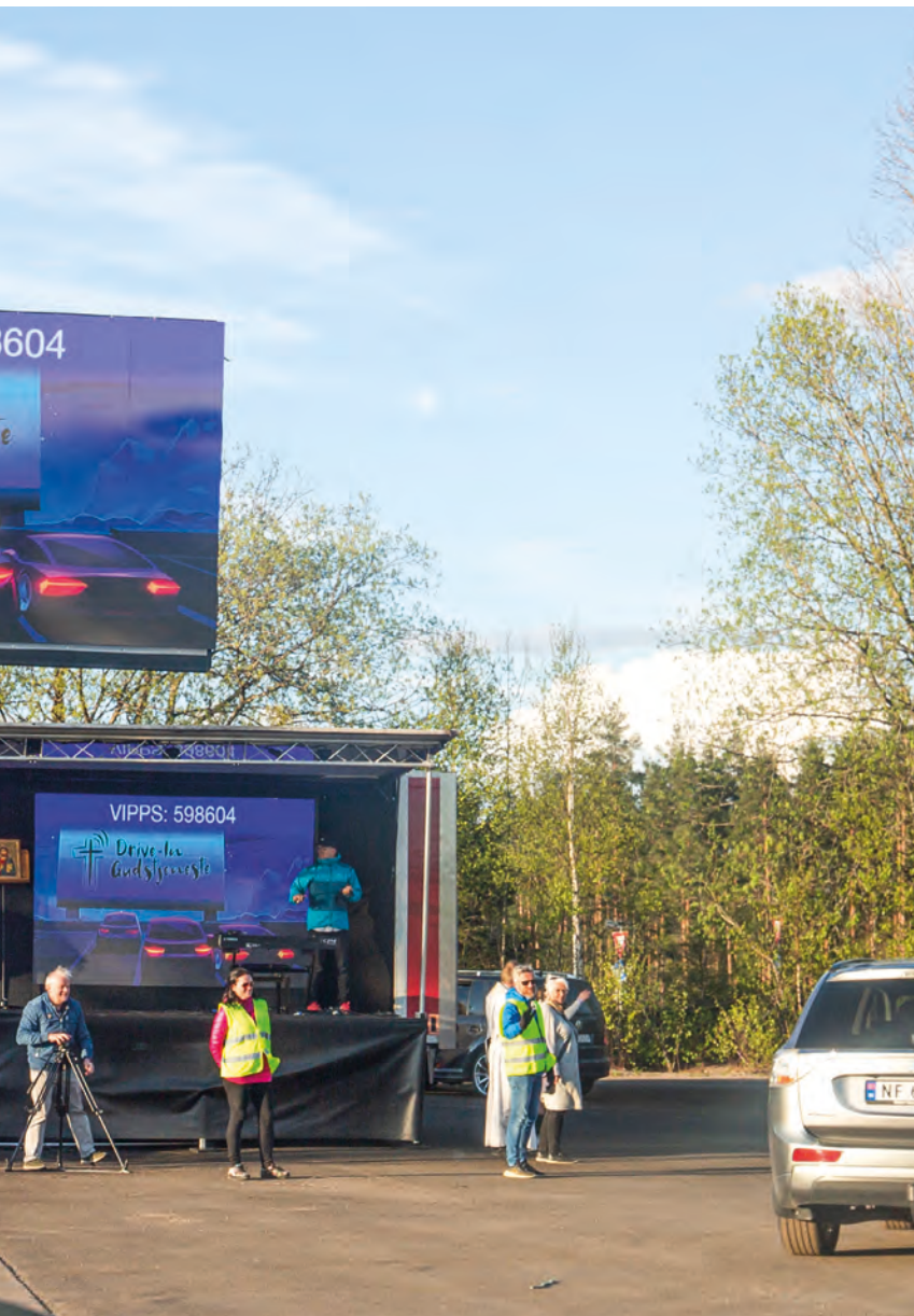
Driveln-gudstjenestene på Geiteryggen har samlet hundrevis hver søndag siden samlingsforbudet kom i mars.