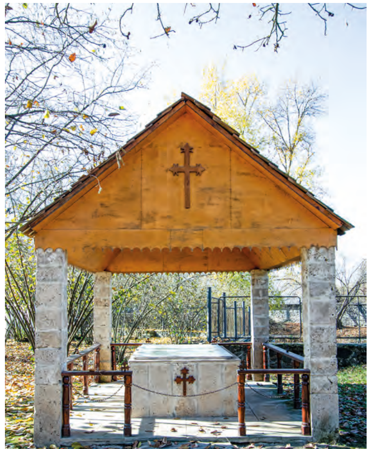
Vannet i dåpsbassenget utenfor kirken i Nich blandes det inn vann fra Jordanelva.

Be for ungdommer og ledere som må tenke nytt for fellesskap.