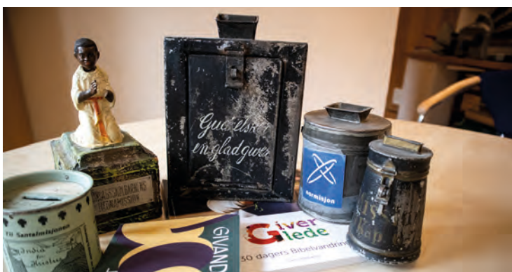
Det er mange måter å gi på. Her er knippe misjonsbøsser som i årenes løp har blitt brukt for å samle inn penger til misjon.

Du har frihet til å kanalisere dine midler dit du vil. Vi er takknemlige til alle som vil prioritere Normisjons arbeid!