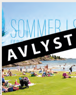
Mange sommerstevner avlyses i disse dager.

” Vi ønsket å skape noe positivt i en krevende hverdag.