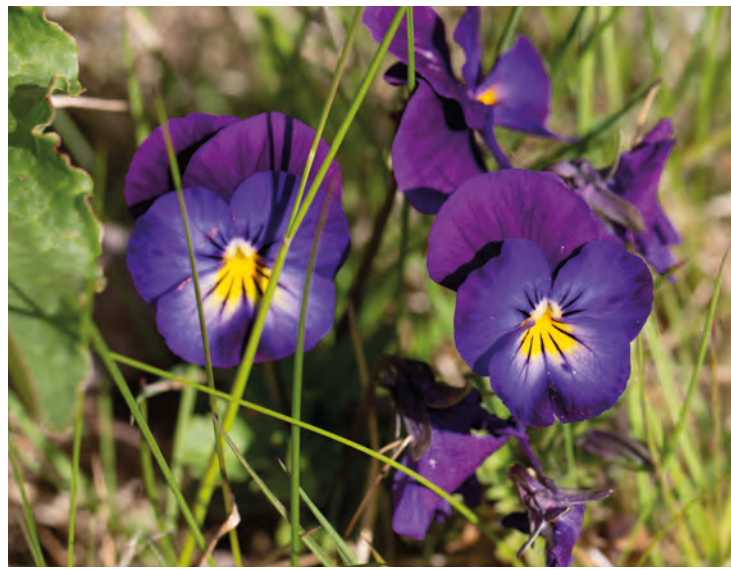
Blomstene som spretter opp i skog og hager, minner oss om at livet lever og at Gud vil gi oss fremtid og håp.