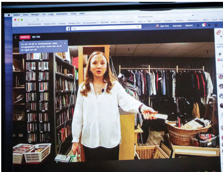
Skjerm bilde fra en av Normisjons nettbaserte stuebasarer.

blitt sveiset mer sammen i en tid der fysiske møter har vært umulig. Vi har også lagt ut små videonutter fra hjemmekontorene våre på facebook og hjemmesiden vår. Acta har hatt ukentlige samlinger for ungdommer, gjennom det konseptet som kalles ActaTalk.