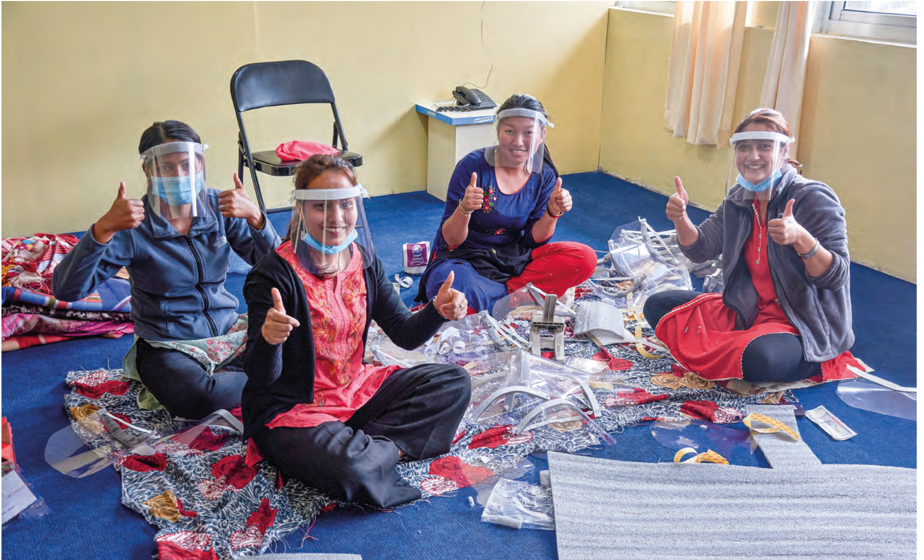
I Okhaldhunga arbeides det for fullt med å produsere verneutstyr i påvente av at koronaepidemien kan komme også dit.