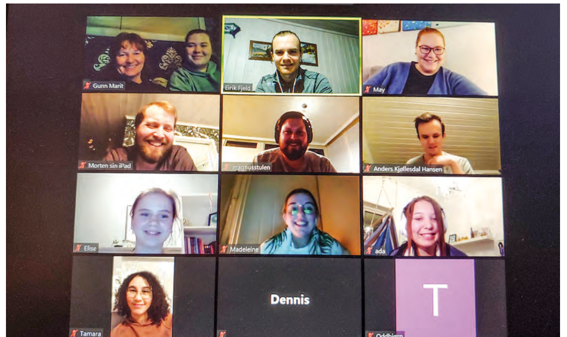
ActaTalk på nett har blitt et populært alternativ til fysiske møter

12. mars kommer for alltid til å bli forbundet med nedstenging av det norske samfunnet. Barnehager, skoler og mange arbeidsplasser stengte ned og det ble hjemmeskole og hjemmekontor «for alle penga». En stor konsekvens av nedstenginga var tilnærmet isolasjon. Barn, ungdommer og voksne var hjemme og hadde plutselig fått mye tid. Ikke var det lov til å samles på fritida og fritidsaktiviteter og møter ble avlyst. Mange tenkte «hva skal vi gjøre nå?» Sånn var det for oss i Acta også. Styremøter, avtaler med foreninger, actalag og andre avtaler ble avlyst. Etter at det første sjokket hadde lagt seg, begynte vi å tenke: «Nå må vi ta i bruk andre arbeidsmetoder. Nå kan vi virkelig ta i bruk de digitale plattformene som finnes bare noen tastetrykk unna.»