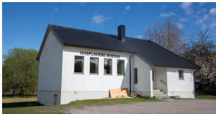
Skogplassene bedehus er endret innvendig i løpet av våren og sommeren.

Bedehuset ligger i Bjørntvedtveien 83, på Kjorbekk i Skien. Alle er velkommen på møtene!