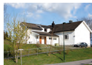
Venstøp bedehus i Skien