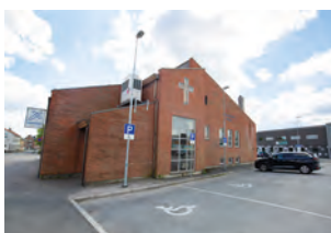
Hauges Minde i Skien