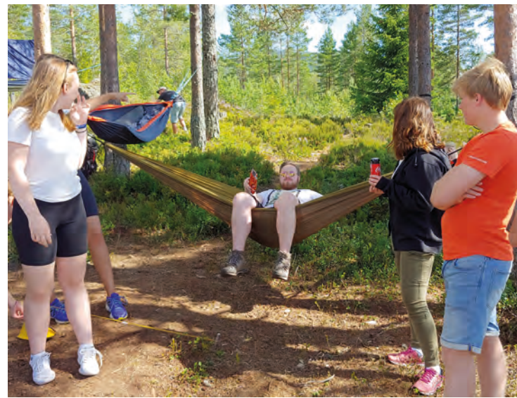
Det var høy trivselsfaktor både i telt og hengekøyer.