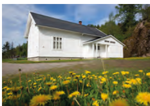
Bergan bedehus i Melum