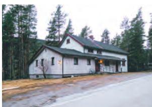
Austbygde bedehus i Tinn