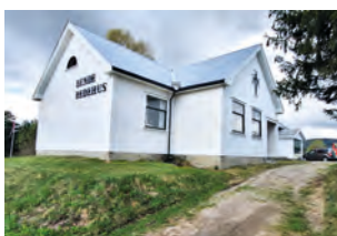
Lunde bedehus i Nome