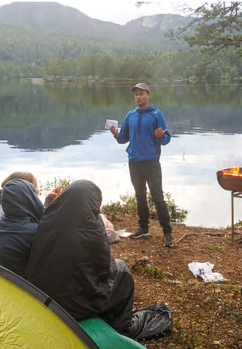
Andakt og undervisning er en viktig del av Actasamlingene.

Fjellvannet i Luksefjell er vel ikke kjent for å være veldig varmt, men mange trosset kulden og hoppet uti.