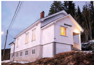
Kjosens bedehus i Drangedal