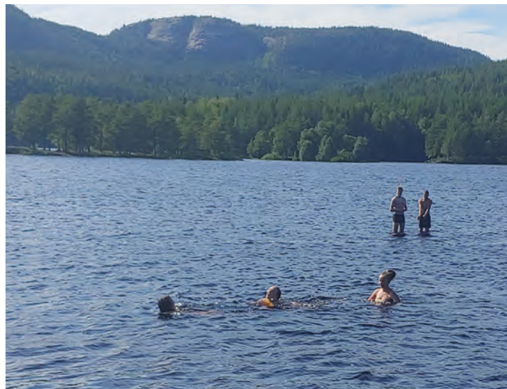
De tøffeste testet badevannet som ikke holdt sydentemperatur.

pelskap, om hvordan noen kunne slippe alt og bli disipler da Jesus sa «følg meg» og om hvilken relevans dette har for dagens ungdommer.