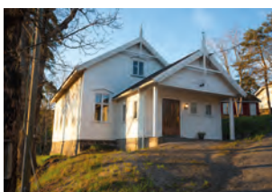
Asdal bedehus i Bamble