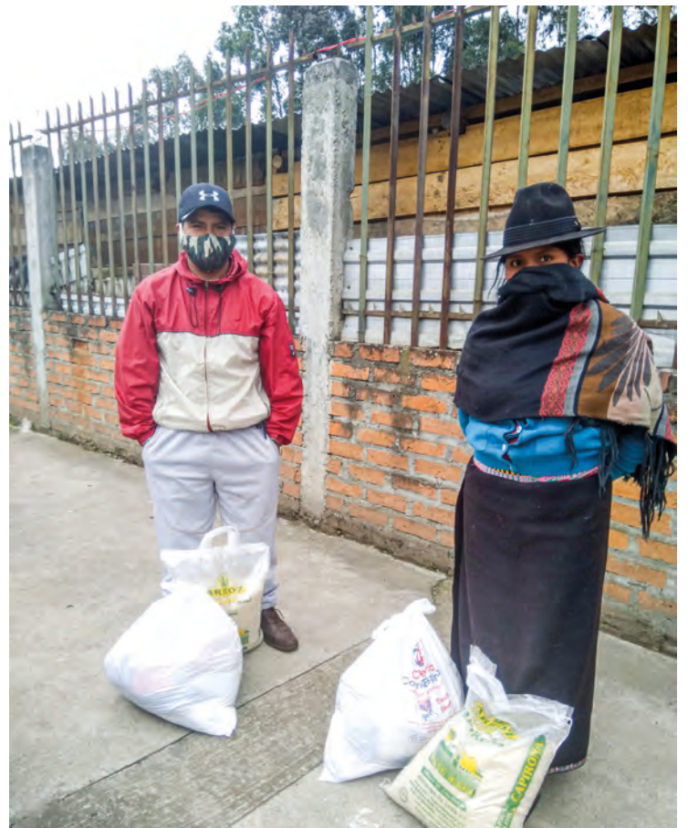
Fra utdeling av mat til korona-rammede i Ecuador.

Be for ungdommer og ledere som må tenke nytt for fellesskap.