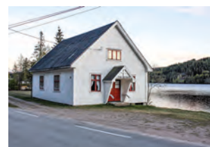
Tyri bedehus i Nome