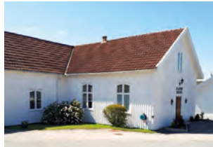
Helgeroa bedehus i Larvik