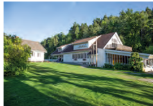
Oksøya leirsted, Brevik