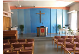
Treungen bedehus i Nissedal