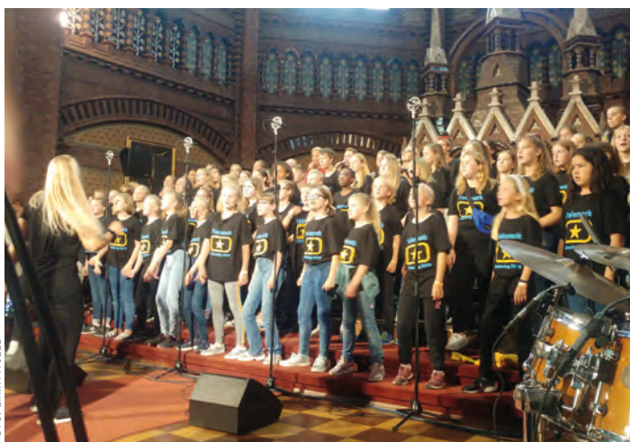
Fra Soul Children Gathering 2019, Skien kirke.

Vi ser stort på viktigheten av at lederne samles. Mister lederne motivasjon har vi heller ingen som kan ta seg av alle barn og unge som ønsker å synge og tilbringe tid sammen i koret, lokallaget eller ungdomsklubben.