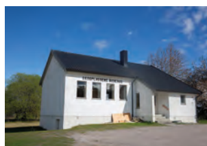
Skoglassene bedehus i Skien