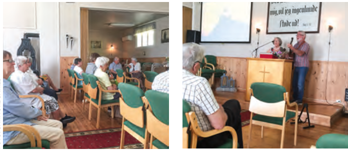
Alt foregikk i trygge former under stevnet i Kjos.

ket i plast, denne gangen. Som seg hør og bør, var det både taler og sang. Det var godt å komme sammen etter en lang koronapause!