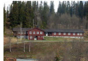
Trovassli leirsted i Vinje