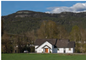
Aas bedehus i Skien