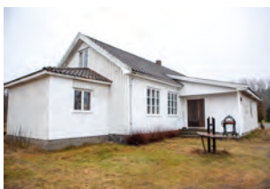
Nalum bedehus i Larvik