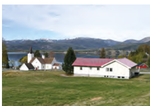
Kyrkjebygda bedehus i Nissedal