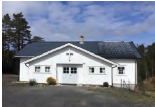
Aakre bedehus i Kroken

22 foreninger i region Telemark responderte på vår henvendelse og ble med i den første utgaven av «bedehusjakten». Her er deres bedehus på ett brett.