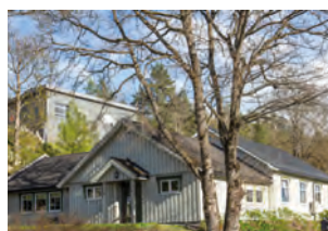
Sneltvedt bedehus i Skien

I tillegg til bedehusene i Telemark, var det med 22 bedehus, skoler og leirsteder i VeBu.