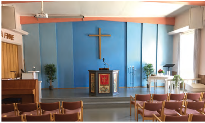
Interiørbilde fra Treungen bedehus.