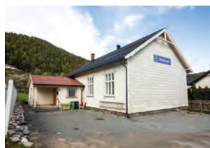
Skotfoss bedehus i Skien