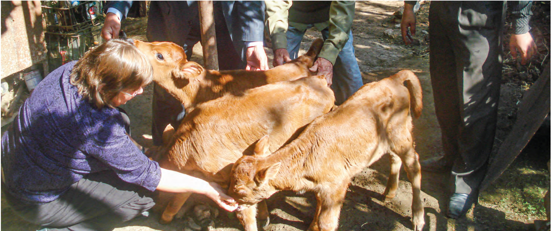
Noen av de første kalvene med norsk far i inseminasjonsprosjektet.