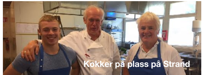
Kokker på plass på Strand

Nyhetsbrev om arbeidet i Normisjon region Vestfold og Buskerud | Årgang 1 | Nr. 4 | August 2018 E. KR.