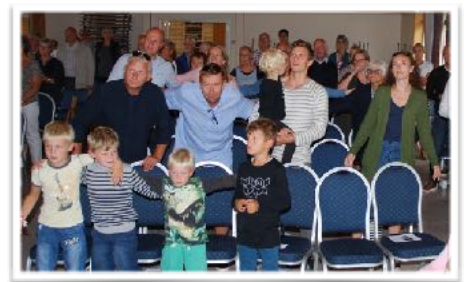
Familiemøte der alle lærte noen av sommerens leirsanger.